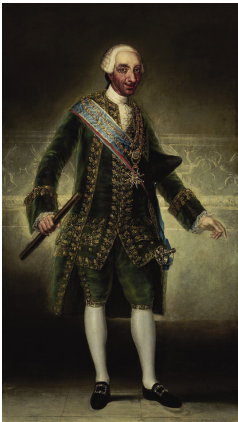
Francisco de Goya El rey Carlos III, c. 1786