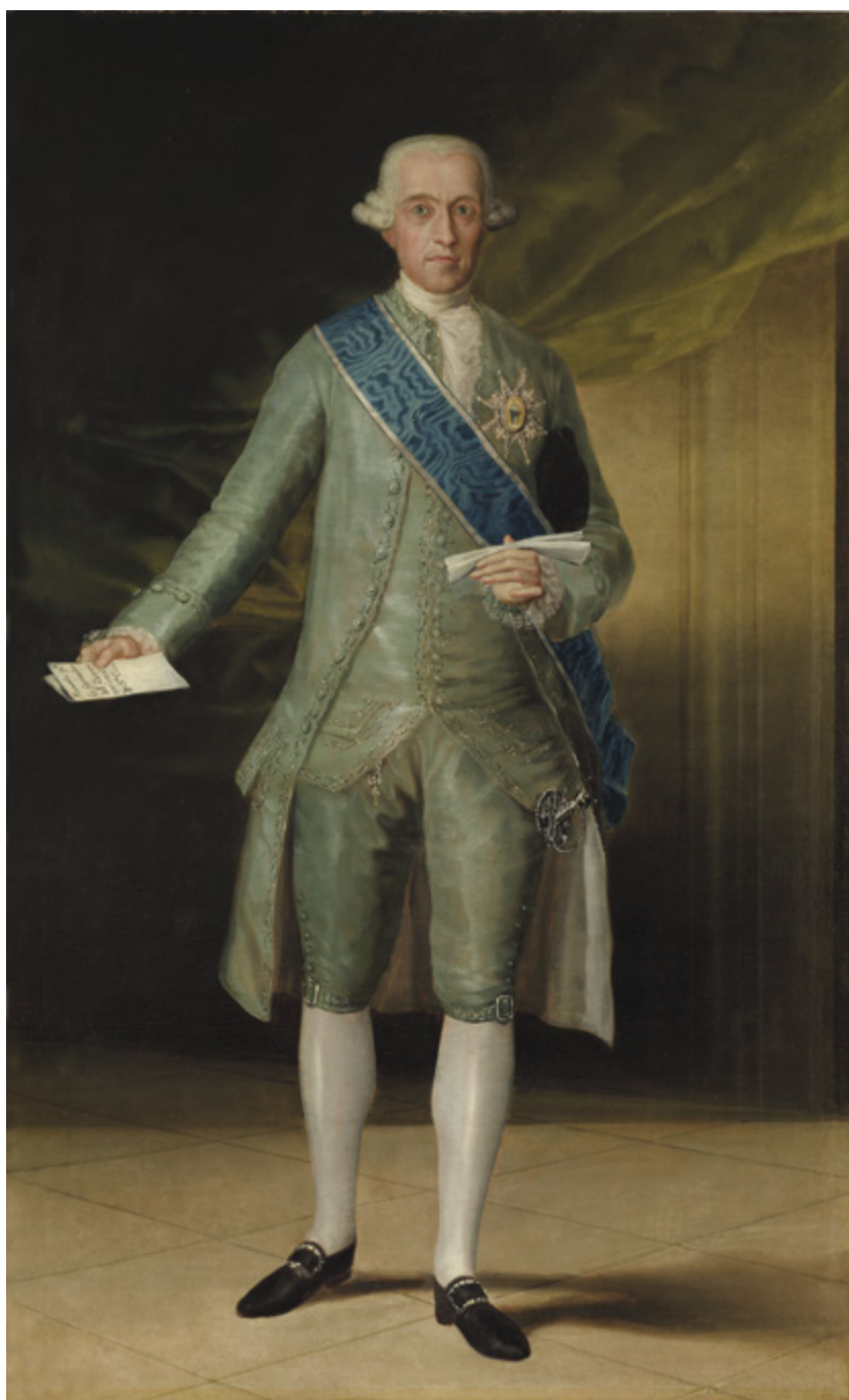
Francisco de Goya José Moñino y Redondo, I conde de Floridablanca, 1781-1783